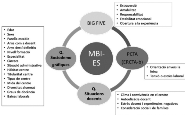
Figura 1. Variables inicials de dades sociodemogràfiques, i d'antecedents i conseqüències de la síndrome de Burnout

Les conclusions que presentem s'extreuen d'un estudi dut a terme amb una mostra de 566 docents d'ESO de la Comunitat de Madrid (Montejo, 2014). La mesura de la síndrome de Burnout es va fer amb el Maslach Burnout Inventory Educational Survey (MBI-ES), el patró de conducta tipus A a l'escala ERCTA-B (Rodríguez, Gil, Martínez, González i Pulido, 1997); la mesura dels principals factors de personalitat amb el Big-Five Factor Markers (segons la versió de l'IPIP). Per complementar la recollida de la resta de dades necessàries es va elaborar un qüestionari de dades sociodemogràfiques, i d'antecedents i conseqüències de la síndrome de Burnout . A la figura 1 es mostren totes les variables que es van tenir en compte en les anàlisis inicials.